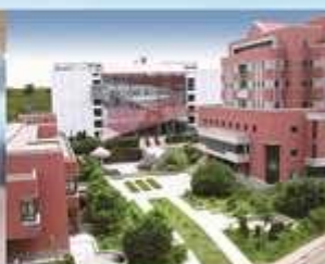
桃園校區 Taoyuan Campus