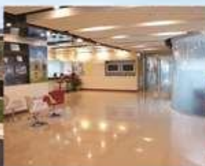
基河校區 Jihe Complex