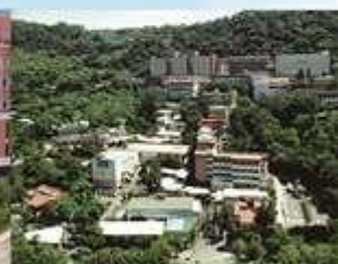
台北校園 Taipei Campus