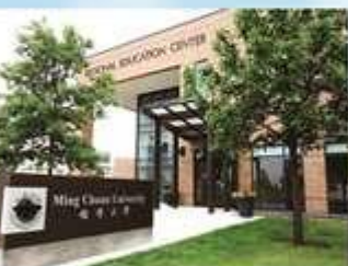
美國分校 Michigan Location, U.S.A.