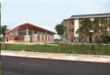
金門分部 Kinmen Location